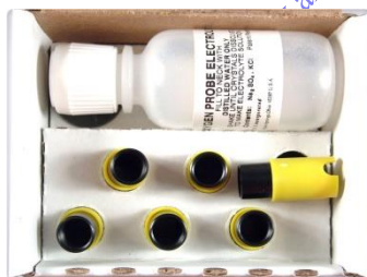
Kit électrolyte & membranes 5908

Copyright AnHydre 06-2020 - Caractéristiques modifiables sans préavis