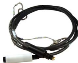
Un câble submersible à double connecteur submersible côté sonde et surface / terminal

Copyright © AnHydre 01-2018 – Caractéristiques modifiables sans préavis