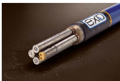
Une sonde ExO et ses capteurs

Kit Terminal YSI ExO-HH2 avec ses accessoires standards