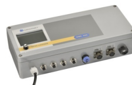
Boîtier multi connexions avec écran