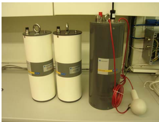
Grande bouée pour canal