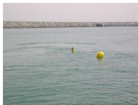
Surveillance de travaux aquatiques