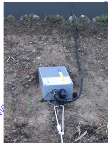
Station temporaire QBox sur berge d'un canal (sonde de niveau)