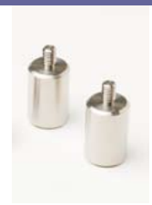
Lests de câble 605978