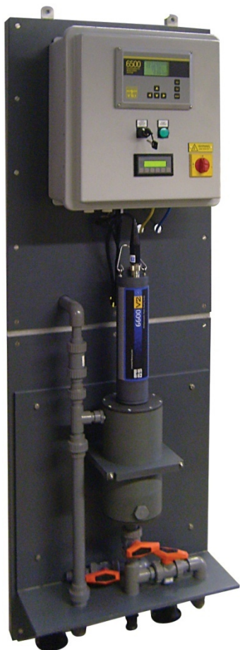
Des sondes compactes pour les mesures ponctuelles et les plate-formes de surveillance.

HydroSAM s'adapte au besoin : analyseur en ligne, montage sur panneau mural, avec ou sans pompe, transmission à distance, cabine abri GRP pour l'extérieur sont parmi les configurations possibles pour la meilleure adéquation à votre application.